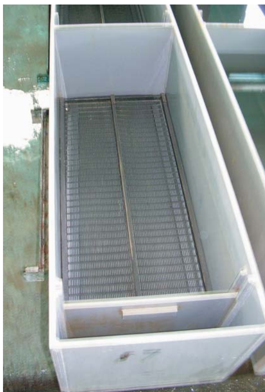
Иллюстрация 8: Различные инкубационные аппараты для икры и личинок форели 1. Калифорнийский инкубационный лоток, 2. Лоток Сэндфорта, 3. Инкубационный аппарат вертикального типа

Существуют противоречивые мнения и публикации относительно чувствительности икры форели к свету. Точно известно, что при помещении форелевой икры на несколько минут непосредственно под прямой солнечный свет, большая часть икры погибнет. Потому на рыбопитомнике рекомендуется поддерживать рассеянное освещение или даже полную темноту.