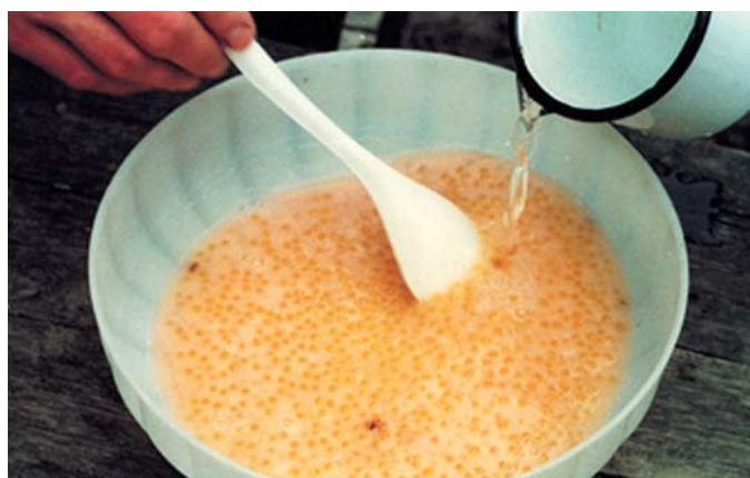
Иллюстрация 5: Добавление воды к оплодотворённой икре