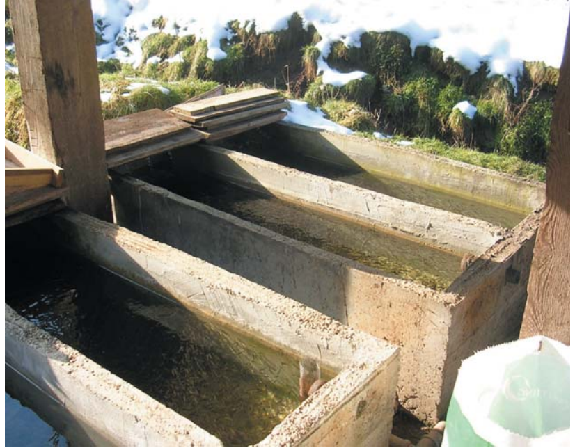
Иллюстрация 11: Типичные бассейны для подращивания молоди

Подращивание молоди рекомендуется проводить в закрытом помещении, где имеется воз-