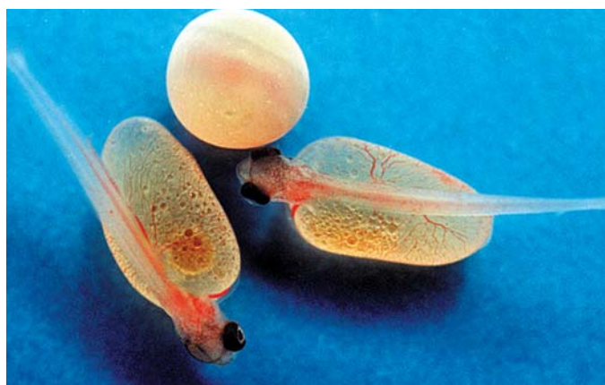
Иллюстрация 7: Выклюнувшиеся предличинки

Сцеживание икры необходимо проводить быстро и бережно. При получении икры от значительного количества самок используется анестетик MS 222. В последнее время также изучаются и используются альтернативные, более дешёвые препараты, например, гвоздичное масло.