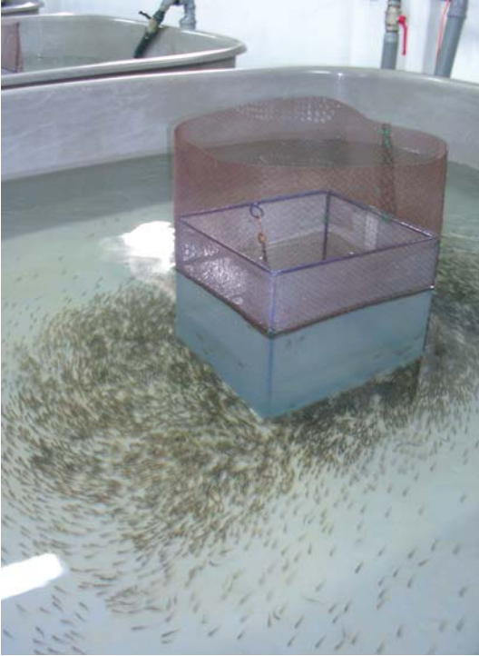
Иллюстрация 10: Типичный бассейн из стекловолокна для подращивания молоди

Плотность посадки молоди в бассейны для подращивания варьирует от 2000 до 5000 шт. личинок/м 2 , а уровень водоподачи должен быть около 0,5–1 л/с (Hoitsy, 2002).