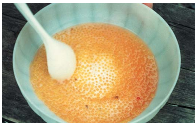
Иллюстрация 4: Оплодотворение (смешивание икры и спермы)