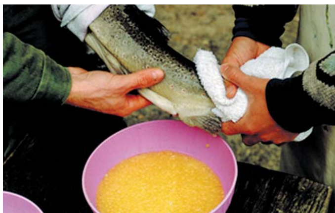
Иллюстрация 2: Ручное получение икры от самок