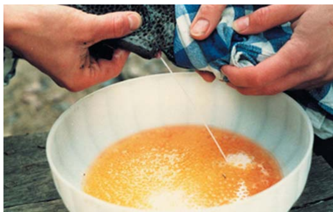
Иллюстрация 3: Сцеживание спермы на икру