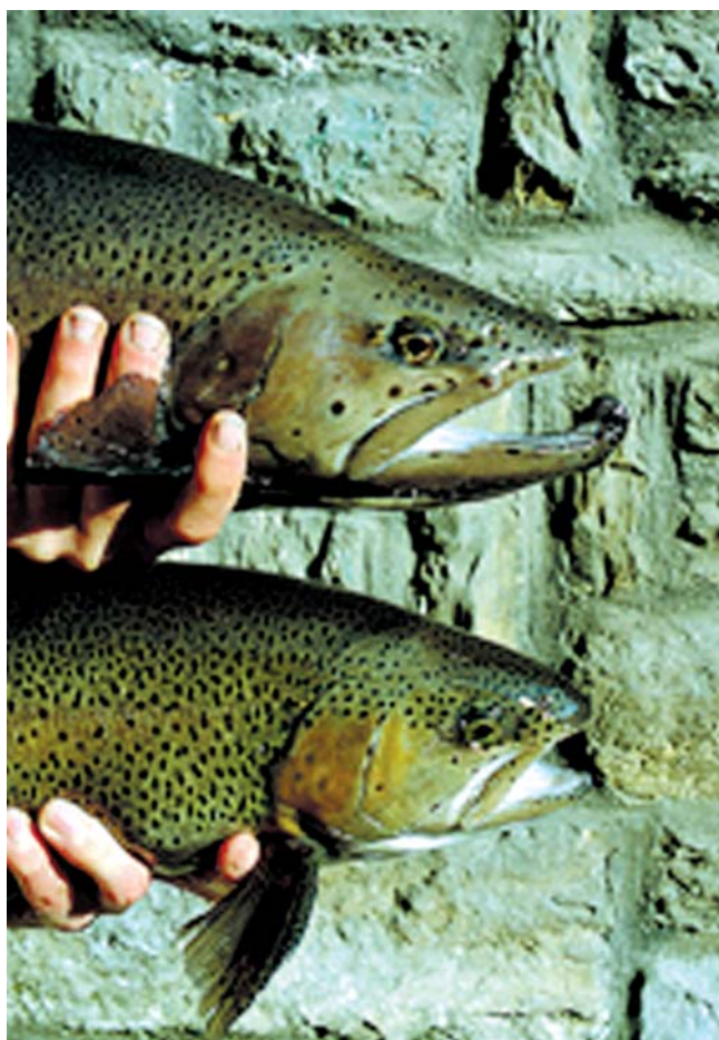
Иллюстрация 1: Различия между самками и самцами по время нерестового сезона

понижение уровня воды при одновременном повышении проточности в чистых бассейнах, где самки и самцы содержатся отдельно. Если это сделано правильно, около 50–70 процентов самок будут готовы к нересту на 7–10 день после отсаживания от самцов. В качестве ещё одного действенного метода имитации условий окружающей среды для ускорения овуляции используется небольшое понижение температуры для озимых рыб и её незначительное повышение в случае яровых.